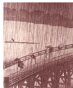
(2) Kioto, antiga capital do Japão.

Pedir-lhe perdão pela minha atitude agressiva e imperdoável, foi tudo o que pude fazer em nosso reencontro, mas, ali mesmo, ante os céus de Kioto (2) implorei aos nossos antepassados me doassem, um dia, a mesma sentença ao seu lado, de modo a me sentir exonerado do arrependimento que me feria todas as fibras do espírito.